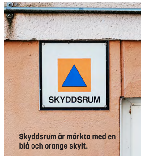
Skyddsrum är märkta med en blå och orange skylt.

Följ myndigheternas information via radio och officiella appar vid en kris – var källkritisk.